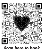
Scan here to book