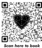
Scan here to book